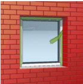
Bild 2: Zum gewünschten Zeitpunkt TP601 durch Abtrennen von Folie und Faden aktivieren.